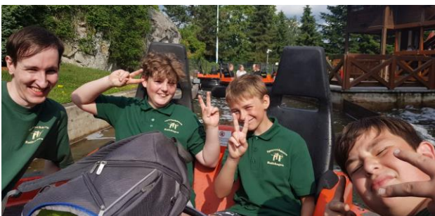
Im Juni fand ein Ausflug in den Heidepark mit 14 Kindern und Jugendlichen sowie 5 Betreuern statt.

Im Herbst nahmen wir erfolgreich mit 4 Schülern an einem Anfängertraining für Freihandschützen in Rodenberg teil.