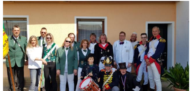
Gruppenfoto vor dem Rundmarsch in Cammer

Wir waren letztes Jahr auf dem Schützenfest in Kathrinshagen, Luhden, Obernkirchen, Minden und Rinteln sowie auf dem Kreisschützenfest in Cammer sehr stark vertreten bei manchen Veranstaltungen auch dank der Napoleon Truppe Rolfshagen. Wir konnten sehr viele neue Kontakte knüpfen.